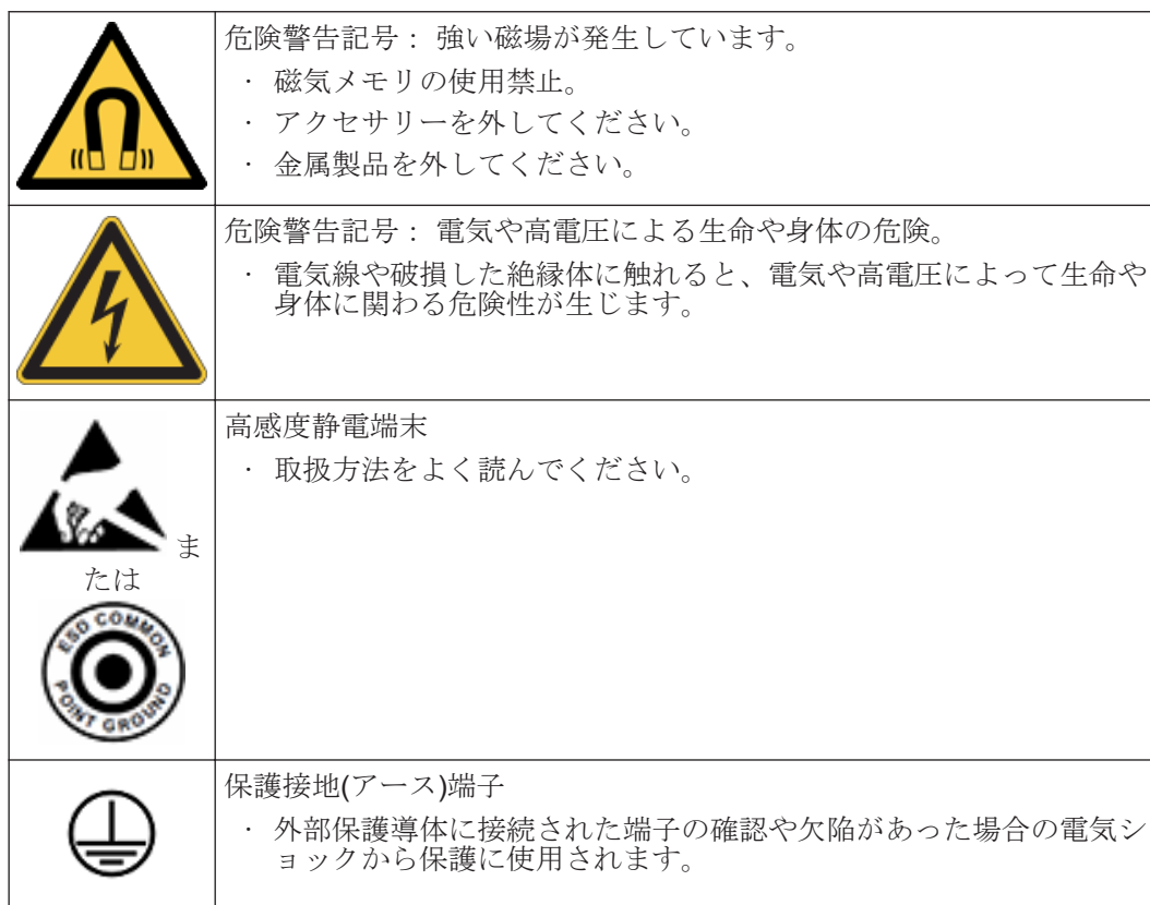
表 2.2: 記号とラベル