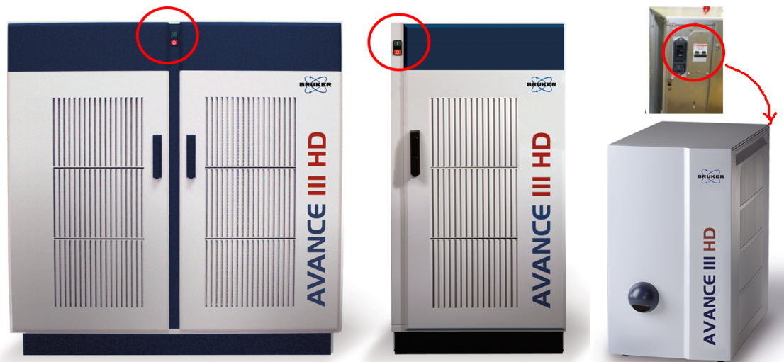
図 3.3: AVANCE III HD シリーズの緊急遮断の場所

AVANCE コンソールの主電源は、緊急遮断としても機能します。主電源をオフにするとコンソールの電源も切れます。