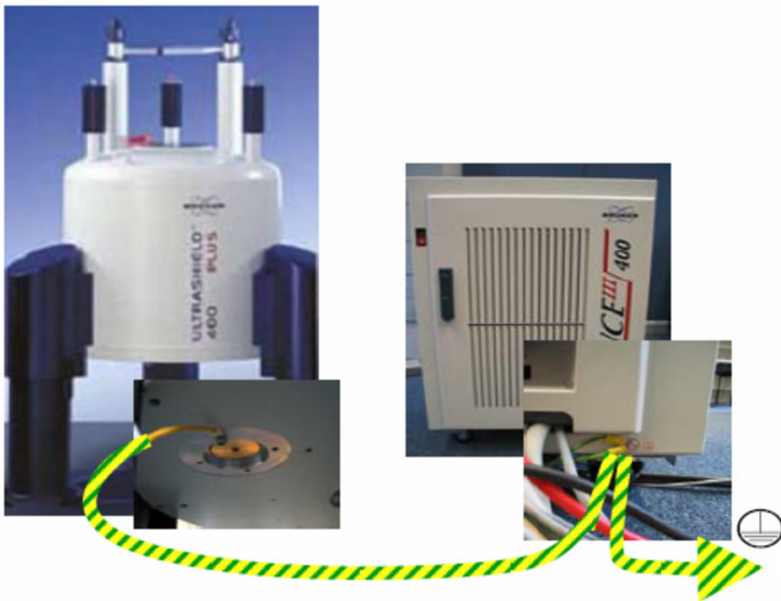
図 3.1: 内部プリアンプ付き AVANCE 核磁気共鳴分光器