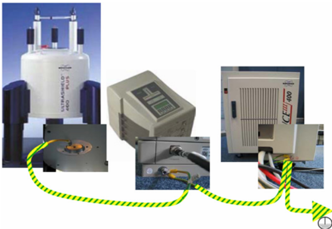
図 3.2: 外部プリアンプ付き AVANCE 核磁気共鳴分光器(HPPR/2)